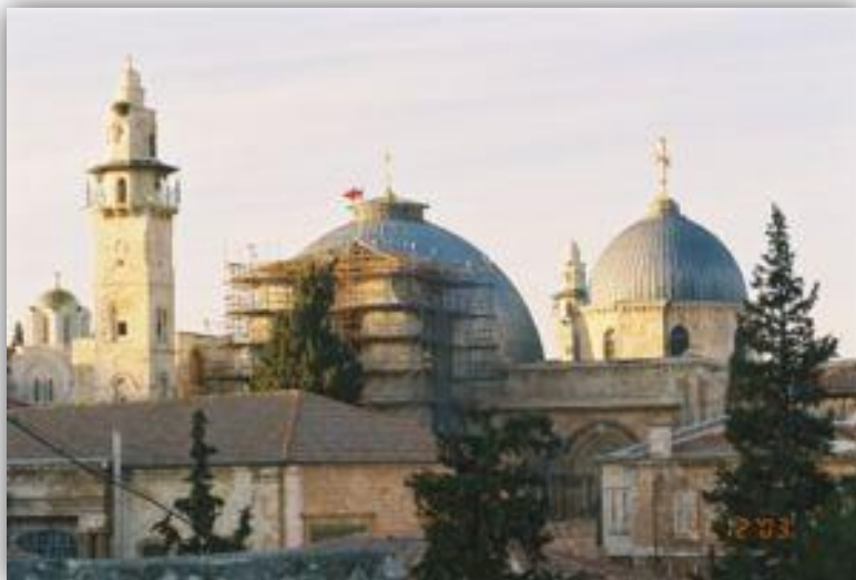
Église du Saint Sépulcre à Jérusalem

Ces quatre éléments sont les piliers de la vie de l'Église et de son unité. La communauté chrétienne de Terre Sainte entend mettre en relief ces éléments fondamentaux et prie Dieu pour l'unité et la vitalité de l'Église répandue à travers le monde. Les chrétiens de Jérusalem invitent leurs sœurs et frères de par le monde à s'unir à leur prière dans leur lutte pour la justice, la paix et la prospérité de tous les peuples de cette terre.