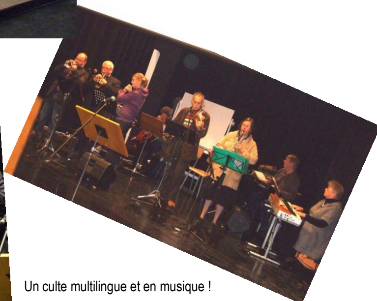
Un culte multilingue et en musique !