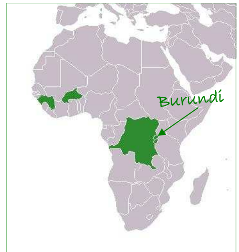
Les 5 pays où Solidarité Protestante mène un programme de lutte contre le Sida.