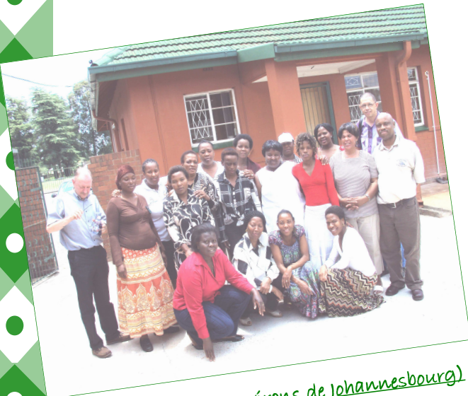
SPRING (dans les environs de Johannesburg) en Afrique du Sud.

L'équipe locale de soins à domicile : deux travailleurs sociaux, deux infirmières et onze travailleurs bénévoles dans les soins de santé, pendant la visite de quelques pasteurs actifs dans la lutte contre le Sida.