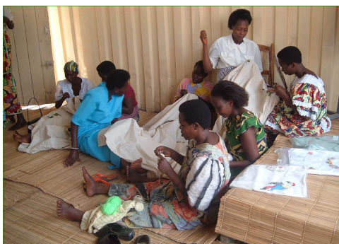
Atelier textile, Burundi

Lorsqu'en Belgique nous sommes malades, nous sommes soutenus par la mutualité ou par la CPAS. Dans la plupart des pays africains il n'y a pas de mutualités publiques. Les gens malades perdent donc souvent leur travail et leurs revenus. C'est pourquoi les églises et groupes d'entraide ou de visiteurs à domicile organisent des petits projets qui génèrent aussi bien de la nourriture que des revenus. Ces projets font partie de programmes plus importants. Souvent ce sont des gens vivant avec le VIH/SIDA ou pauvres qui collaborent dans ces projets. Avec les revenus, de la nourriture saine et des médicaments peuvent être achetés. Les projets procurent un revenu et ainsi un degré de dignité. Les gens sont fiers d'être indépendants et ne plus devoir vivre comme des mendiants. Les femmes jouent un grand rôle dans ces activités.