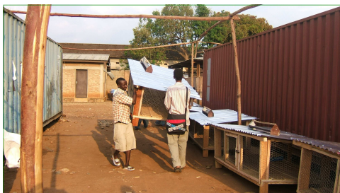
Elevage de poules au Burundi